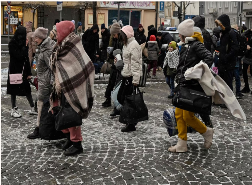
PÅ FLUKT: Ukrainske flyktninger ankommer togstasjonen i Przemysl, øst i Polen.