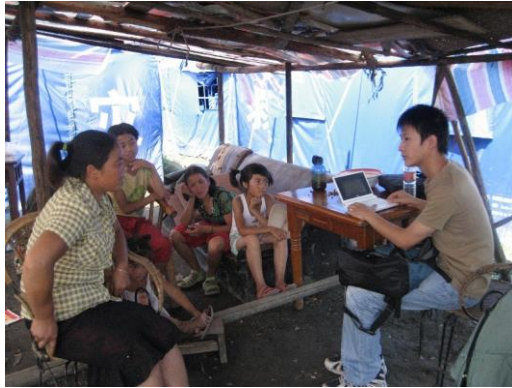
Intervjusituasjon under feltarbeid i Vest-Kina

Forskning på og i Kina har stått sentralt i en årrekke. Fafo har et kontor i Beijing og drar god nytte av sitt brede nettverk i landet. Sammen med en kinesisk partnerorganisasjon, CASTED, gjennomførte 4 av gruppenes forskere et kvalitativt, eksplorerende feltarbeid i Vest-Kina som forberedelse til en omfattende levekårsundersøkelse samme sted. En av Fafos ansatte er i ferd med å avslutte et doktorgradsarbeid om oppfatninger av ulikhet og rettferdig fordeling i Kina. Hun presenterte papers om den kinesiske velferdsstaten og tillit til